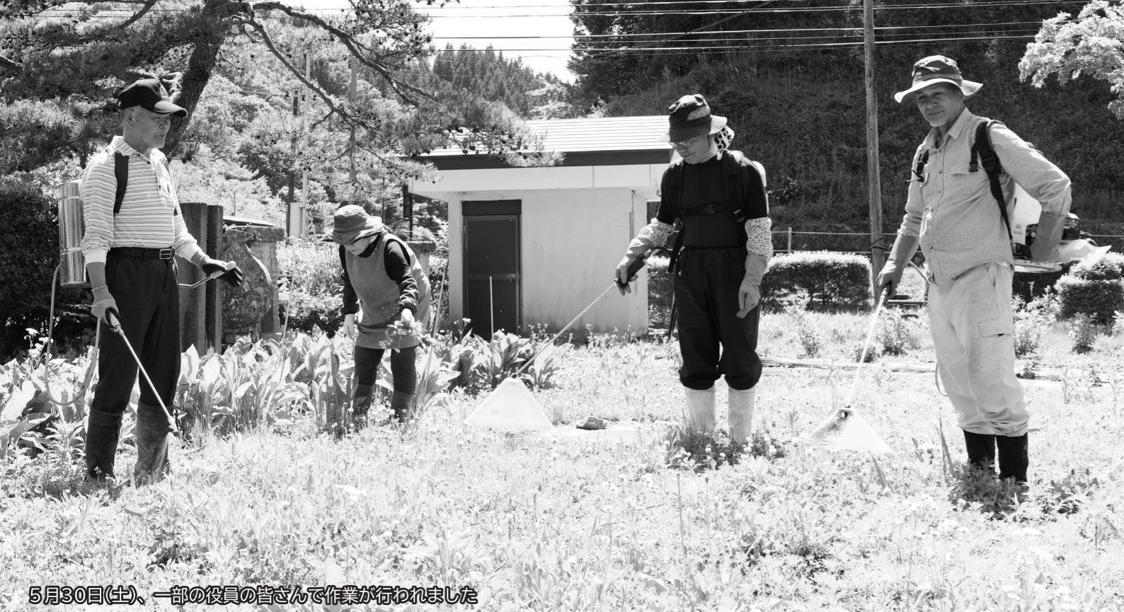
5月30日(土)、一部の役員の方々と作業が行われました