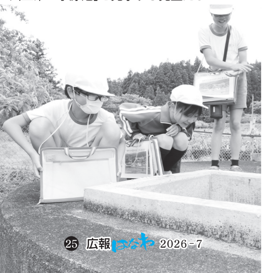
「川上第2水源池」を見学する児童たち

6月5日(金)、笹原小学校で、生活環境課職員による出前講座「埴町の水道水はどこから来るの?」が行われました。対象の4年生3人は、地球上の水や町の上下水道施設についてなどの座学を受けた後、「川上第2水源池」を見学し、児童たちはあらためて水の大切さを学びました。