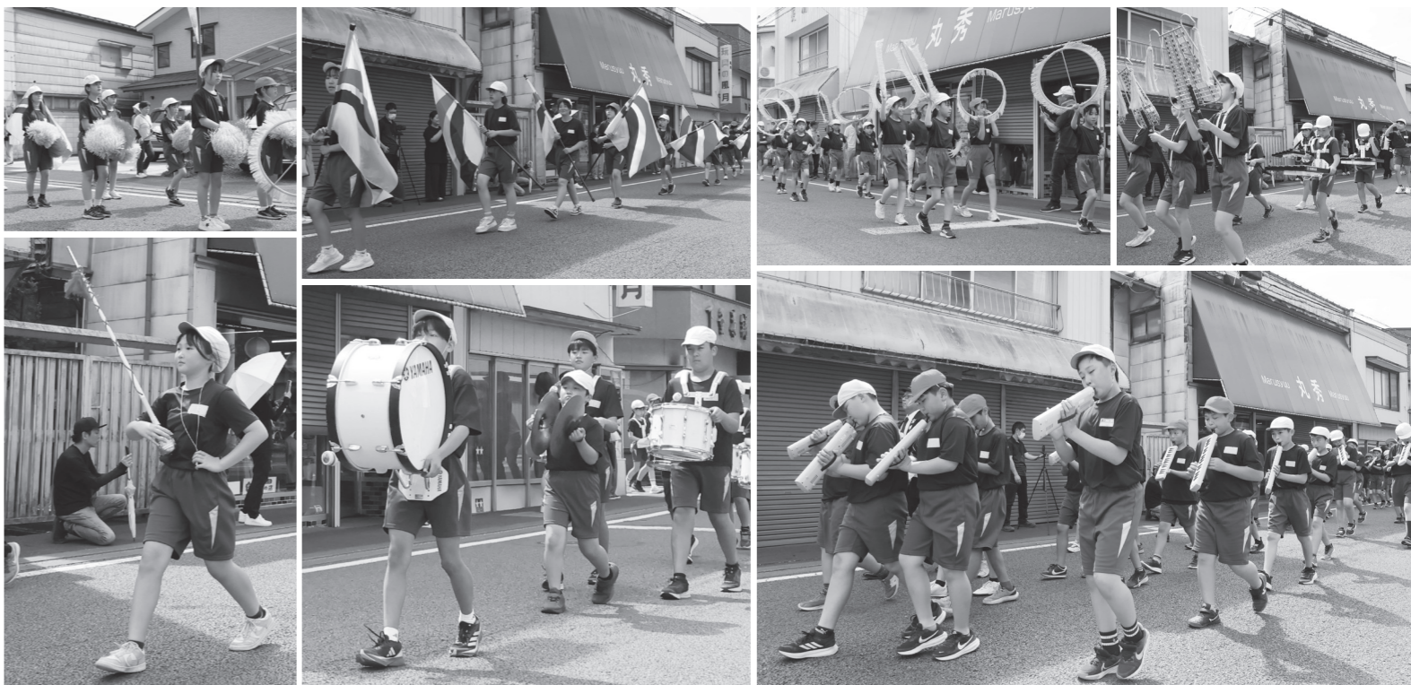
堂々と行進を行う児童たち(右5も同じ)

5月19日(火)、埴小学校5・6年生が交通安全・地域安全合同鼓笛パレードを行いました。パレードは、埴小学校をスタートして商店街を行進しました。埴小学校の鼓笛隊自体が今年で最後ということもあり、沿道には最後の鼓笛パレードを見ようと多くの皆さんが集まりました。強い日差しの中、児童たちは空に向かってまっすぐ背筋を伸ばし、堂々と行進しました。先導した広報車では、児童がアナウンスを担当し、交通安全と地域安全を呼びかけました。