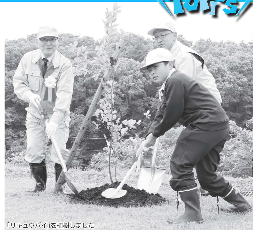
「リキュウバイ」を植樹しました