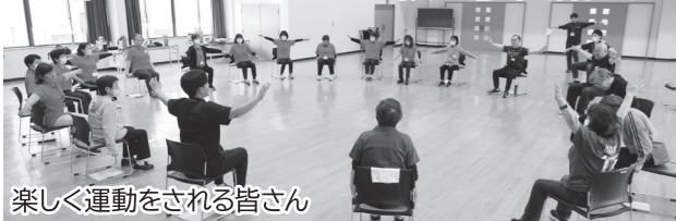
楽しく運動をされる皆さん

5月14日(木)、埴農村労働福祉会館で、令和8年度「楽しく元気アップ教室」の開講式が行われました。同教室は、全6回のプログラムで、各回無理なく楽しく継続できるメニューを講師と一緒にを行います。初回は体力測定やイスに座ってできる簡単な運動を行い、参加された皆さんは楽しく汗を流しました。