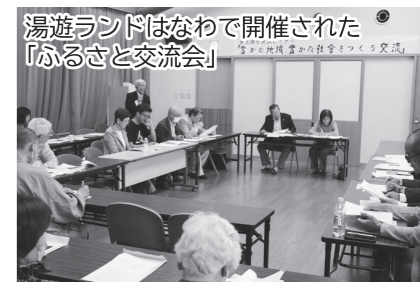
湯遊ランドはなわで開催された「ふるさと交流会」

5月16日(土)・17日(日)の2日間、東京埴会「春のふるさと訪問のたび」が開催され、会員の皆さんは湯遊ランドはなわや町散策などを満喫しました。16日(土)は、湯遊ランドはなわで総会が行われた後、「豊かな地域 豊かな社会をつくる交流 ~ふるさと心の豊かな交流をつくる~」をテーマに「ふるさと交流会」が行われました。