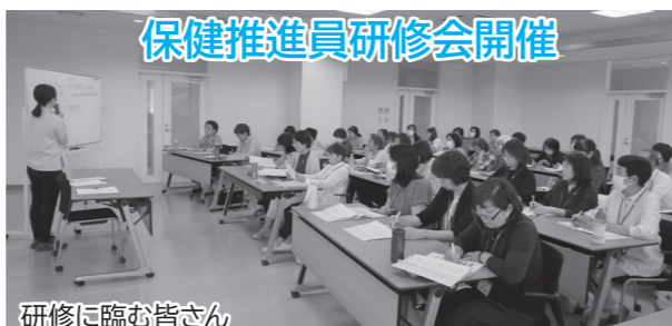
研修に臨む皆さん