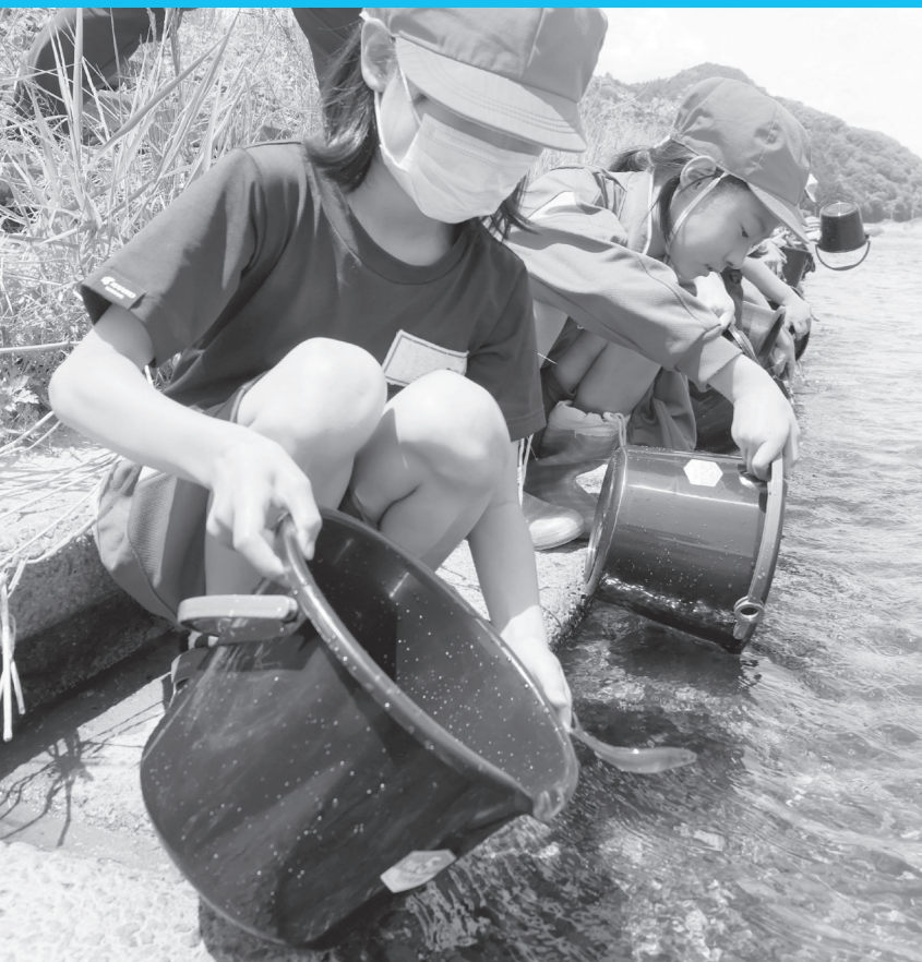
鮎を放流する児童たち